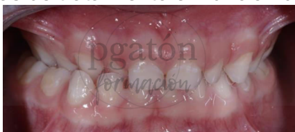
. Pistas planas